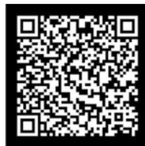
Fig. 2. Código QR para descargar la aplicación Radiación en Medicina.

La navegación resulta sencilla e intuitiva, de forma que cualquier tipo de usuario puede utilizarla con como-