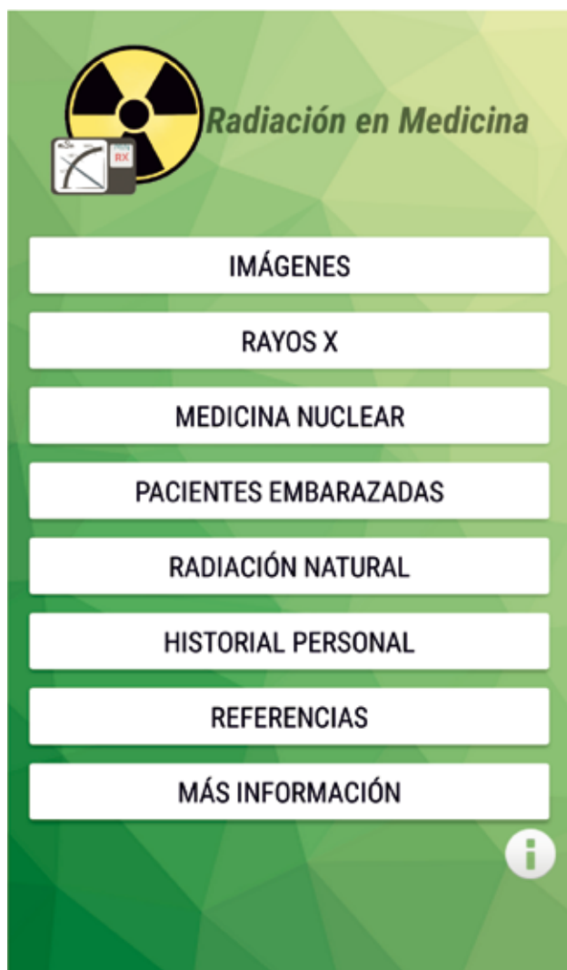
Fig. 1. Índice general.

La información se ha dividido en ocho secciones bien diferenciadas, como se puede observar en la Figura 1: Imágenes, Rayos X, Medicina Nuclear, Pacientes Embarazadas, Radiación Natural, Historial Personal, Referencias y Más Información.