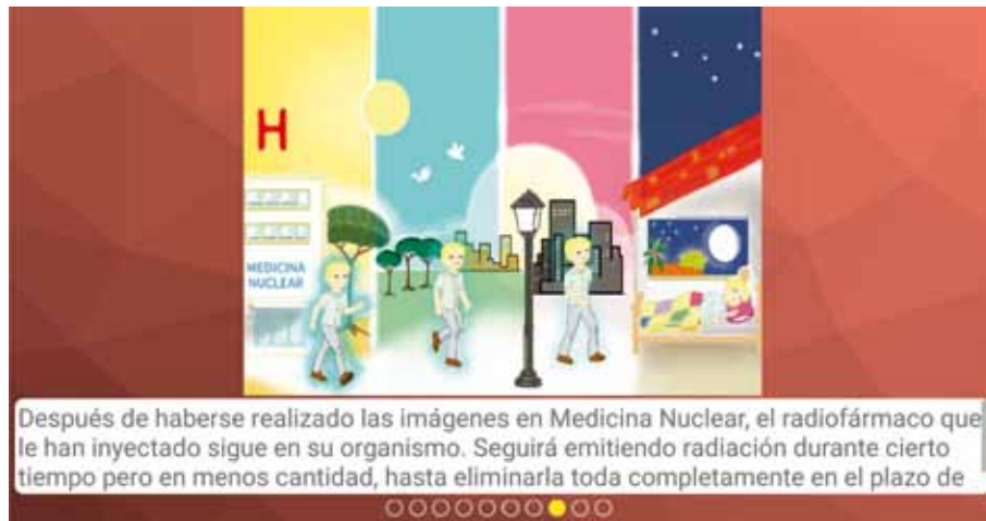
Fig. 3. Dibujo incluido en la sección Imágenes .