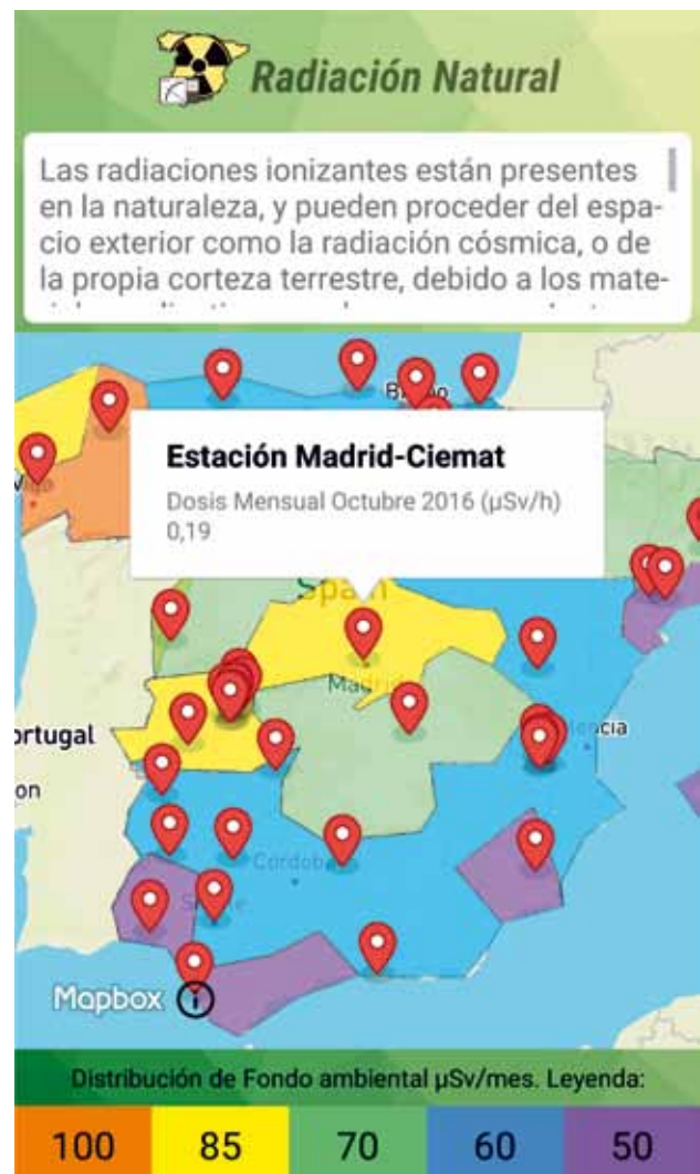
Fig. 5. Sección Radiación natural .